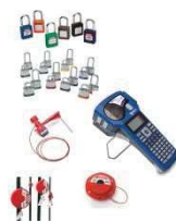
อุปกรณ์สเปรย์มือถือ