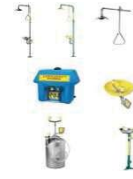
อุปกรณ์ชำระล้างตู้กดเงิน