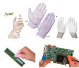
ถุงมือสำหรับห้องคลีนรูม

3. กลุ่มสินค้าและบริการด้านระบบบำบัดน้ำเพื่ออุปโภคและบริโภค (Water Solution Products) หรือ WATER โดยบริษัทแบ่งการดำเนินงานออกเป็น 4 ส่วนหลักดังนี้