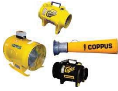
อุปกรณ์เป่า-ดูด อากาศ