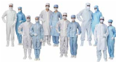
ชุดทำงานในห้องคลีนรูม