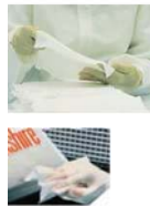
ผ้าเช็ดชั้นงาน