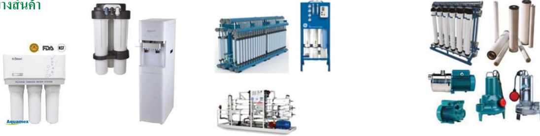
เครื่องกรองน้ำสำหรับครัวเรือน