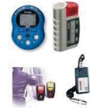
เครื่องวัดแก๊ส

2. กลุ่มสินค้าและบริการด้านการควบคุมสภาพแวดล้อม (Control Environment Products) หรือ CE เป็นอุปกรณ์ที่ใช้ควบคุมสภาพแวดล้อมให้มีความสะอาด ปลอดภัยในสถานที่ปฏิบัติงานที่ต้องการการควบคุม เช่น โรงพยาบาล ห้องคลีนรูมในกลุ่มอุตสาหกรรมผลิตยา กลุ่มอุตสาหกรรมผลิตเครื่องมือแพทย์ กลุ่มอุตสาหกรรมผลิตชิ้นส่วนอิเล็กทรอนิกส์ กลุ่มอุตสาหกรรมผลิตชิ้นส่วนรถยนต์ เป็นต้น สินค้าในหมวดนี้ ได้แก่ อุปกรณ์ทำความสะอาด อุปกรณ์ป้องกันไฟฟ้าสถิตย์ ถุงมือในงานสภาพควบคุม เครื่องเขียนสำหรับห้องคลีนรูม ผ้าคลีนรูม และชุดคลีนรูม